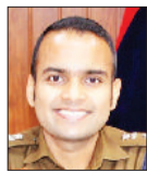
एसपी सिद्धान्त जैन।

फतेहाबाद। पुलिस अधीक्षक सिद्धान्त जैन ने नागरिकों को सावधान करते हुए कहा कि 14 मार्च की राष्ट्रीय लोक अदालत की आड़ में साइबर अपराधी सक्रिय हो गए हैं। ठग अब आम जनता को उनके लंबित कोर्ट केस या ट्रैफिक चालानों के निपटारे का झांसा देकर निशाना बना रहे हैं। फि होकर उनके जाल में फंस जाएं। एसपी ने बताया कि साइबर ठग व्हाट्सएप और एसएमएस के जरिए लोगों को एक लिंक भेजते हैं, जिसमें दावा किया जाता है कि लोक अदालत में उनके चालान पर भारी छूट दी जा रही है। इस संदेश में अक्सर अरेस्ट वॉरंट या कोर्ट में