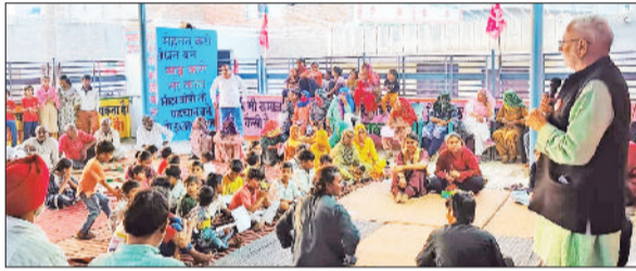
फतेहाबाद। ग्रामीण सभाओं को संबोधित करते माकपा नेता।