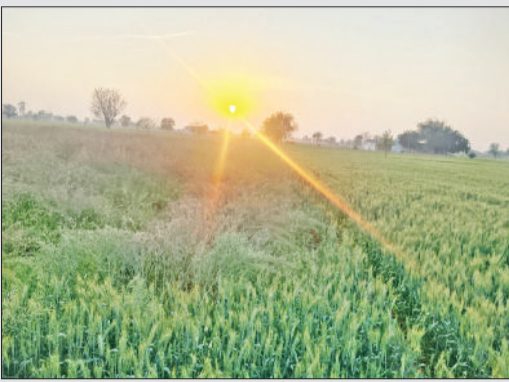
फतेहाबाद। धूप में खड़ी गेहूं की फसल।