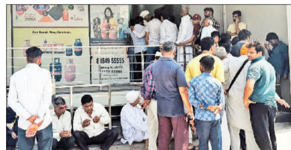
मूना। इंडेन गैस एजेंसी के गेट के बाहर सिलेंडर पर्वी लेने वालों की लगी हुई भीड़।

एजेंसी ने कहा-सप्लाई नियमित, बिना बुकिंग सिलेंडर नहीं मिलेगा