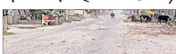
जाखल। बदहाल रेलवे रोड।

जाखल स्थित नई बस्ती रेलवे रोड के निर्माण की बहुप्रतीक्षित मांग अब जल्द पूरी होने जा रही है। लोक निर्माण विभाग ने इस सड़क के निर्माण के लिए टेंडर प्रक्रिया पूरी कर ली है। विभाग का दावा है कि इसी माह में निर्माण कार्य शुरू कर दिया जाएगा। एक किलोमीटर