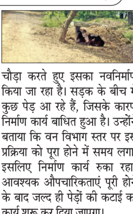
चौड़ा करते हुए इसका नवनिर्माण किया जा रहा है। सड़क के बीच में कुछ पेड़ आ रहे हैं, जिसके कारण प्रक्रिया को पूरा होने में समय लगा, इसलिए निर्माण कार्य रुका रहा। आवश्यक औपचारिकताएं पूरी होने के बाद जल्द ही पेड़ों की कटाई का कार्य शुरू कर दिया जाएगा।