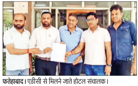
फतेहाबाद। एडीसी से मिलने जाते होटल संचालक।