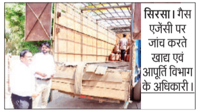
सिरसा। गैस एजेंसी पर जांच करते खाद्य एवं आपूर्ति विभाग के अधिकारी।

फतेहाबाद। सरकार की ओर से कमर्शियल गैस सिलेंडर की सप्लाई रोकने के बाद शहर के विभिन्न होटलों में गैस की सप्लाई प्रभावित हो रही है। गैस सप्लाई न मिलने से संचालकों के सामने अपने होटलों को बंद करने की नौबत आ गई है। गैस समस्या को लेकर वीरवार को शहर के विभिन्न होटल संचालक एडीसी से मिलने के लिए पहुंचे। इस दौरान होटल संचालकों ने प्रशासन से मांग की है कि जिला प्रशासन की ओर से कुछ स्टॉक उन होटल संचालकों को दिया जाए, ताकि उनके होटल में होने वाले कार्यक्रमों में कोई बाधा न पहुंचे, वहीं सरकार की ओर से आगामी जो आदेश होंगे उसकी पालना भी जरूर की जाएगी। साथ ही उन्होंने कहा कि होटल होटल में जो कर्मचारी काम करते हैं, उनके खाना बनाने के लिए भी गैस सिलेंडर की सप्लाई मिल पाना मुश्किल हो रही है, इसलिए उन कर्मचारियों को रोजी-रोटी की ध्यान में रखते हुए उन्हें कुछ गैस सिलेंडर दिए जाएं। बता दें कि व्यावसायिक एलपीजी सिलेंडरों की आपूर्ति बंद होने से होटल, रेस्टोरेंट और वेंडर संचालकों के लिए परेशानी बढ़ गई है। कई रेस्टोरेंट व होटल संचालकों ने लकड़ी तो कुछ ने डीजल भी का इस्तेमाल शुरू कर दिया है।