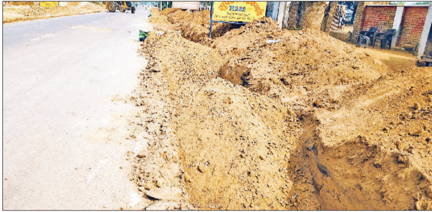
भूना। सड़क को चौड़ा करने के कार्य में कम पत्थर व अधिक डाली हुई मिट्टी।